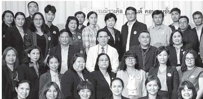
ย้ำพัฒนา สำราญ สารบรรณ์ รองปลัดกระทรวงเกษตรและสหกรณ์เป็นประธานเปิดการประชุมเชิงปฏิบัติการเรื่อง "การพัฒนาวัฒนธรรมองค์กรของกระทรวงเกษตรและสหกรณ์" ที่โรงแรมมิราเคิลแกรนด์คอนเวนชั่น.